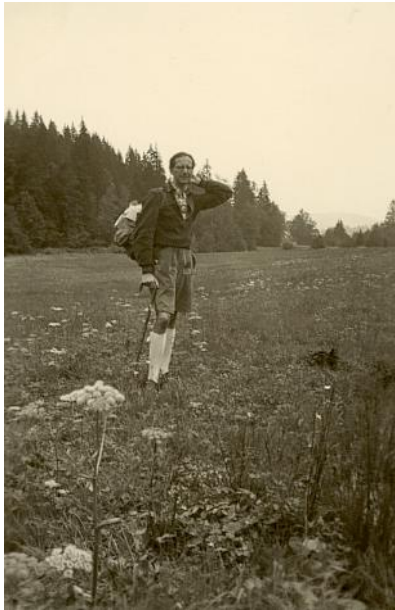
Spikingsteig über Mauth nach Kleinphilippsreuth

Als die Sonne nun sank in abendlich rötlicher Helle, Kamen am Ziele wir an: Kleinphilippsreuth *) hieß das Dorf