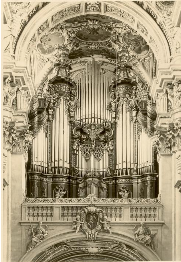
Größte Orgel der Welt *)