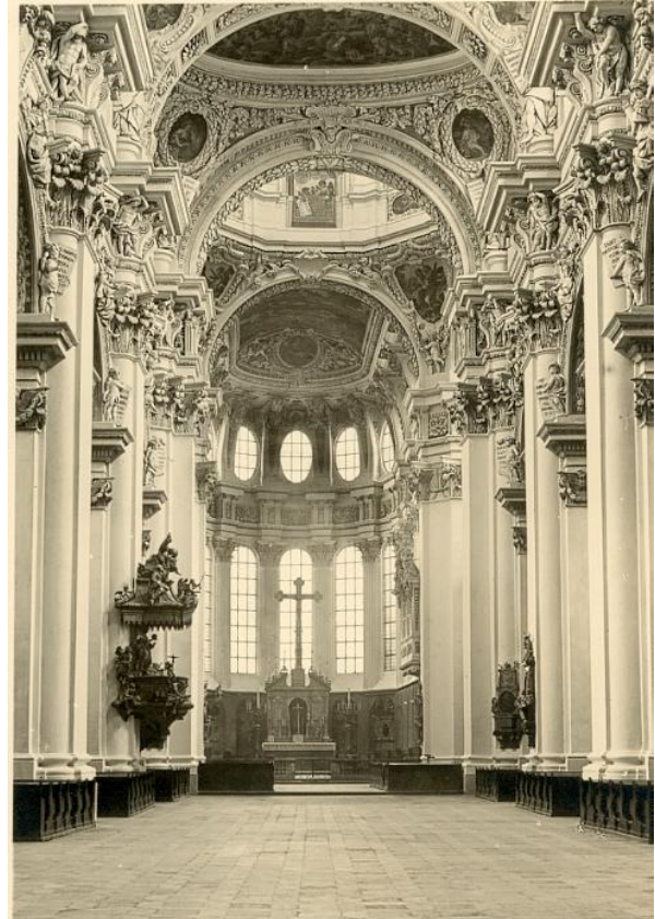
Im Dom zu Passau

Betend faltet ein Dom und bittend ein Wald seine Hände, Und das Rauschen des Winds - Orgel ist es im Dom;