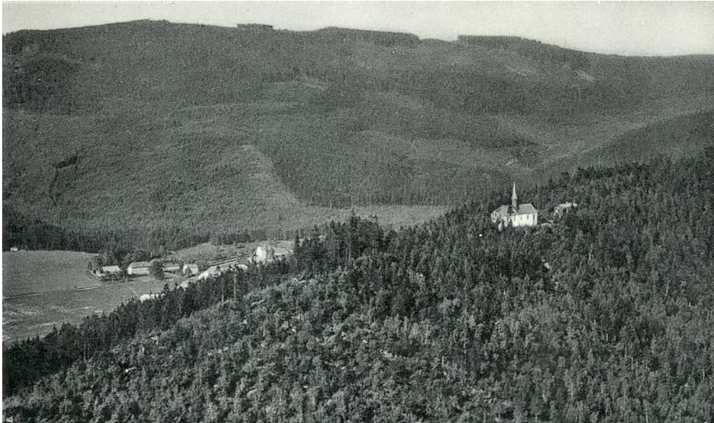
Luftaufnahme (1936): Wallfahrt Mariahilf mit Lambach b. Lam (Bayr. Wald)

Deutschland aber, die Heimat, sie glich dem wogenden Meere, Gipfel an Gipfel gereiht endet im Dufte die Welt.