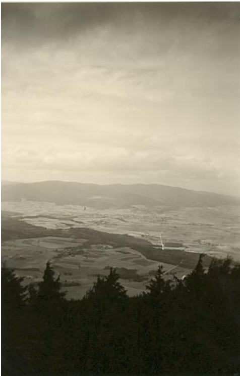
Aussicht vom Burgstall (976 m) Hoher Bogen nach Furth

„Und es lächelte Gott, da wurde das schöne Land Böhmen“, so singt der Dichter es uns, so lag es unter uns da.