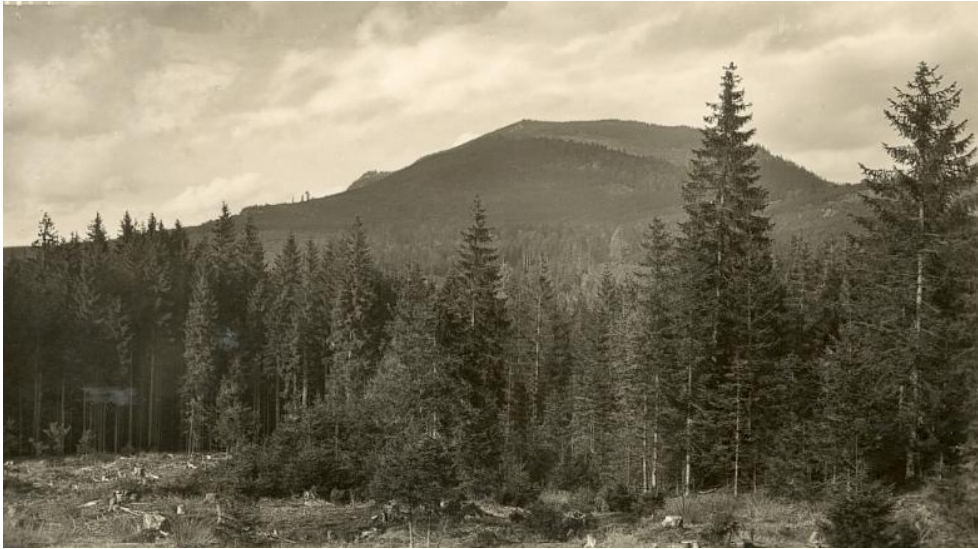
Der Falkenstein im Bayrischen Wald

Brüllt dort nicht Hafner der Wurm, zwischen mannshohen Farnen Ringelnd den tödlichen Schweif? Kniert dort nicht Siegfried am Quell?