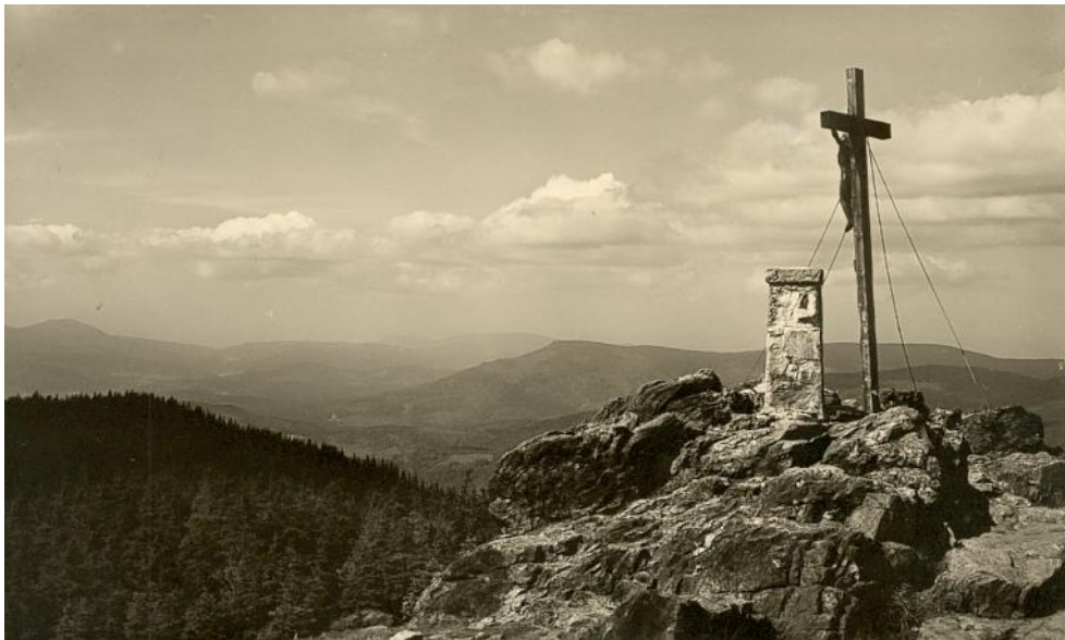
Blick vom Rachelgipfel (1452 m ü. NN) in Richtung Arber, Osser und Falkenstein

Sicher wußten wir es, wir sahen nun niemals sie wieder, denn sie gingen ins Tal, wir aber saßen im Dunst, Der im Laufe der Zeit verdichtend sich ballte und wälzte, Und zum Überfluß dann fiel noch als Regen herab, Erst nur rieselnd und fein, dann aber stärker und stärker; Warten konnten wir nicht, also brachen wir auf. Hui, wie pfiß da der Sturm, verrann die Ferne in Strömen, Als wir in eiligem Marsch rannten am Kreuze vorbei, Das der Wetter Wut wie ein Mahnmal trotzte und standhielt, Voller Schwermut und Trost, traurig und schön war das Bild.