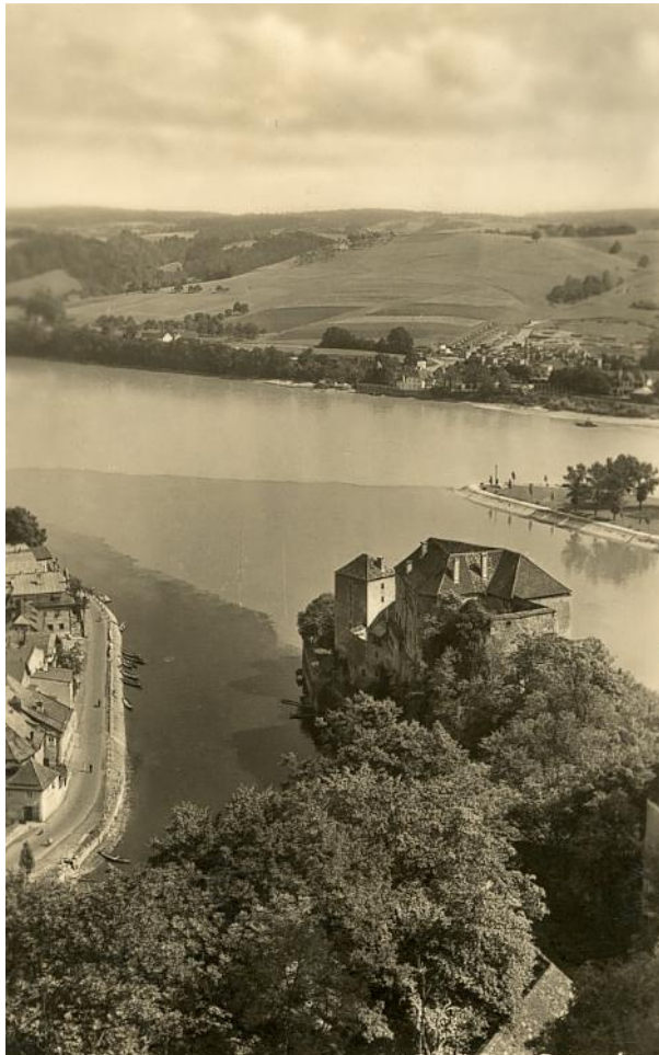
Passau, Blick vom Oberhaus Passau auf Dreiflußeck Donau, Inn, Ilz (rechts: hellgrün der Inn; mitte: gelbgrau die Donau; links: schwarzbraun die Ilz)

Bis wir auf alter Burg, der Feste Oberhaus standen, Welche die Inselstadt weithinschauend beherrscht.